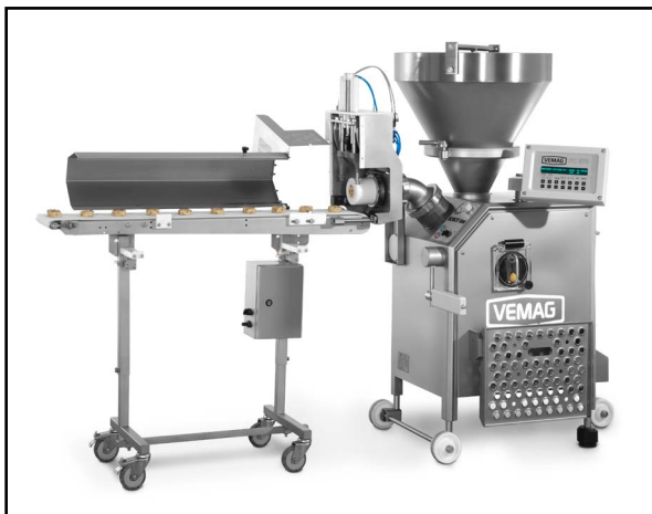
Robot 500 con taglierina pneumatica 811

Non siete soddisfatti dalla precisione di peso offerto da altre dosatrici? Siete alla ricerca di una soluzione che possa garantire pesi esatti ogni volta? Scegliete dunque la dosatrice di pasta Robot 500 di VEMAG e approfittate di porzionatura estremamente accurata. Volete lavorare nuovi e diversi prodotti per rinnovare la gamma e trovare una soluzione sufficientemente flessibile? La dosatrice di pasta Robot 500 di VEMAG è ciò che fa per voi con la versatilità tipica della gamma VEMAG. Non sapete ancora come migliorare la vostra produzione? Acquistate allora la dosatrice di pasta Robot 500 di VEMAG e approfittate di rendimenti più elevati e qualità eccellente per paste ad alta resa come paste di segale e pane integrale.