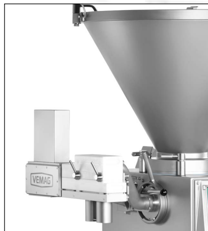
Ball Control BC237

Prodotti pronti attraggono i clienti come una speciale delizia. Un motivo in più per produrre squisite prelibatezze. E con Ball Control 237, saranno sempre grandi risultati. Non importa se di forma sferica, oblunga, con bordi ad angolo o con estremità arrotondate: si può essere fantasiosi come si desidera.