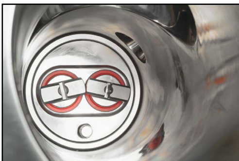
Lucidatura specifica del cilindro di alimentazione