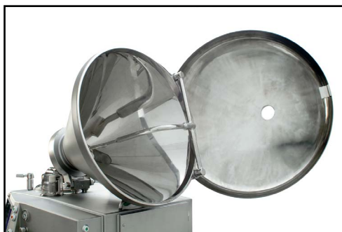
Il coperchio tramoggia può essere aperto inclinandolo