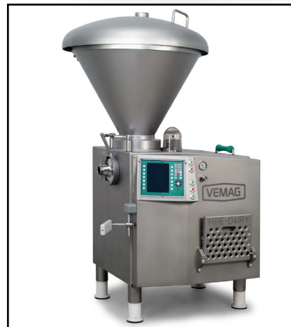
HPE linea latticini

Porzionate prodotti di alta qualità? Esigete solo il più elevati standard di sicurezza del prodotto e di igiene? A ciò corrisponde il certificato di accettazione attrezzatura USDA. La serie HPE linea latticini di VEMAG ha ottenuto tale certificazione per la corrispondenza dei materiali e del processo cui si intende dedicata. Per ottenere la certificazione si è dovuto ottemperare a quanto sancito dalla norma 3-A standard sanitari, numero 23-05. VEMAG ha ottenuto la certificazione nel novembre 2007. Ciò fa di VEMAG l'unico produttore sul mercato le cui pompe sottovuoto soddisfano tali severi requisiti USDA.