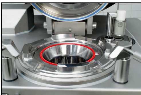
Connettore del vuoto e unità di alimentazione lucidati